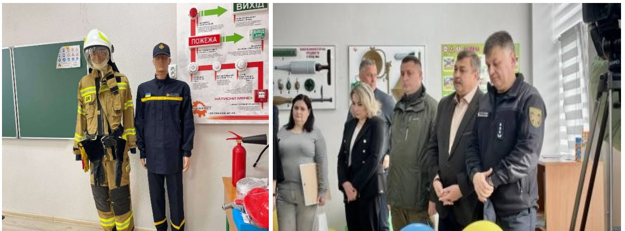
На світлині: відкриття класу безпеки в Росохацькому ліцеї Городенківської міської ради