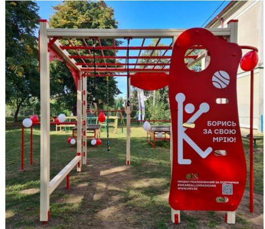
(жовтень 2023 року)

Також, в жовтні 2023 року у міському парку м.Городенка відбулося відкриття дитячого майданчика, який місту подарували благодійні організації СОС Дитячі Містечка Україна та Terra des hommes.