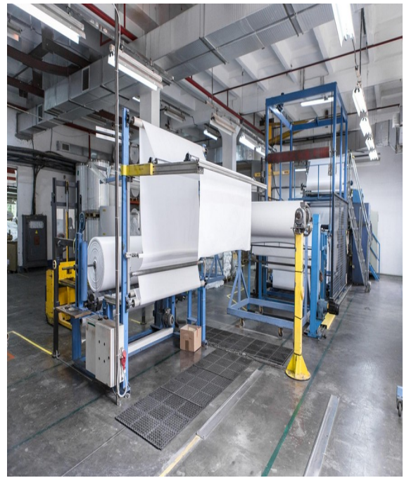
Виробництво захисного покриття для автомобілів на ТОВ «ТРОКС Україна»

Станом на 1 січня 2024 року до Коломийського району релоковано із зони бойових дій 23 суб'єкти господарювання, в тому числі 11 юридичних осіб і 12 фізичних осіб-підприємців. Релокований бізнес працює в таких галузях: сільське господарство, обслуговування мототехніки, оптова і роздрібна торгівля, послуги харчування, перукарські, освітні та логістичні послуги, виготовлення ножів, пошиття одягу, виробництво брикетів.