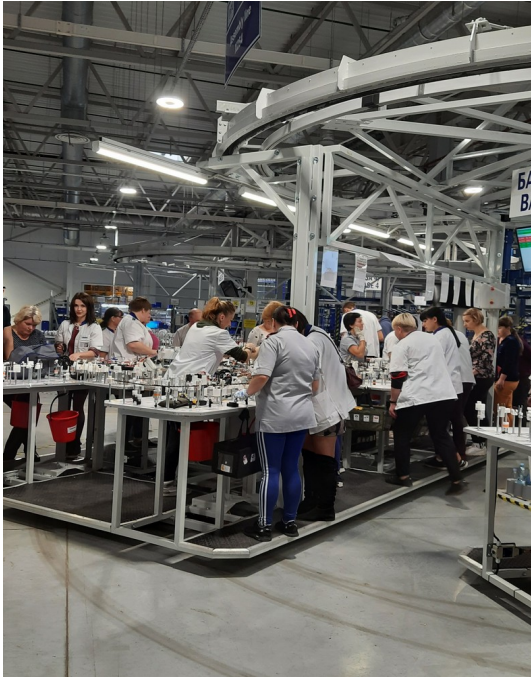
Виробництво кабелю на ТОВ «ЛЕОНІ Ваєрінг Системс УА ГмбХ»