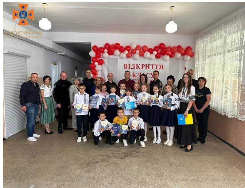
На світлині: відкриття класу безпеки в Трацькому ліцеї Городенківської міської ради Матеївецької сільської ради