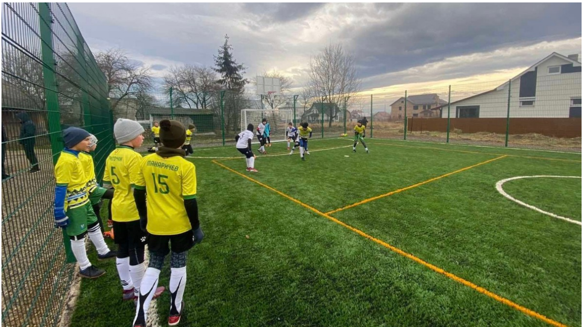
(спортивний майданчик в м.Коломиї)

Завершено роботи щодо спорудження спортивного майданчика зі штучним покриттям по вул.Владики Софрона Дмитерка в м.Коломиї. Майданчик відзначається різноманітністю застосувань, де можна грати у футбол, волейбол та баскетбол. У подальшому планується поруч з майданчиком облаштування спеціального спортивного обладнання.