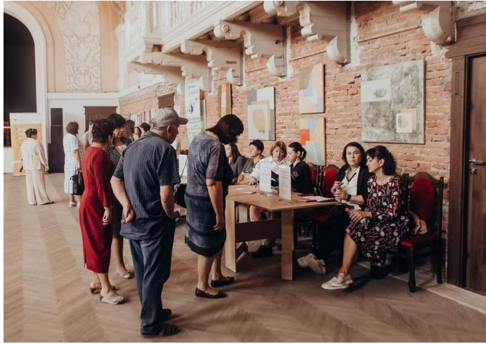
«Ярмарка вакансій» у місцевій філармонії «Сокіл» м. Коломия (29.09.2023р.)

8. Наука, освіта, культура, охорона здоров'я, фізична культура і спорт, сім'я, жінки, молодь та неповнолітні.